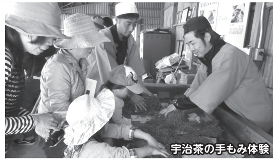
宇治茶の手もみ体験