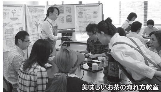
美味しいお茶の淹れ方教室

日本茶インストラクターが、抹茶・玉露の淹れ方を丁寧にお教えます。 ◎各:400円(お菓子付)