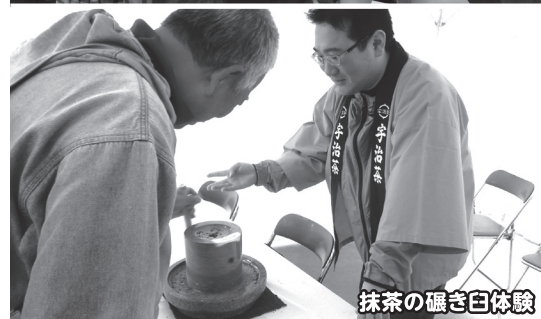
抹茶の碾き臼体験