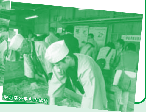
宇治茶の手もみ体験