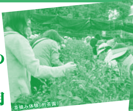
茶摘み体験(煎茶園)