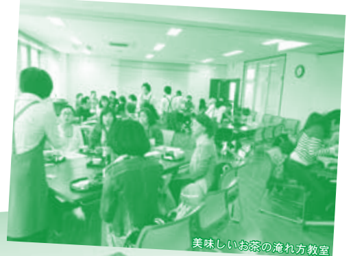
美味しいお茶の淹れ方教室

"茶の木人形"の新旧名品を展示。 平成の茶の木人形師・大岩広生氏による 上林清泉や楽之軒、楽山などの模刻を初公開。 新作の販売もあります。