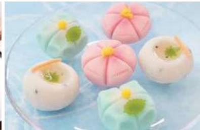
季節を感じる和菓子「練り切り」 写真はすべてイメージです。