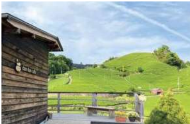
茶畑に囲まれたdandancafeで至福の時間を