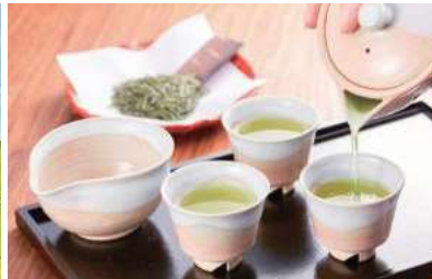
シングルオリジン新茶でお茶を淹れる体験