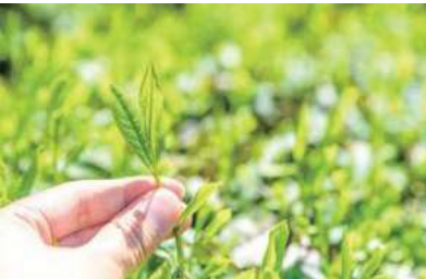
新茶特有の爽やかな旨味や甘みを楽しんで