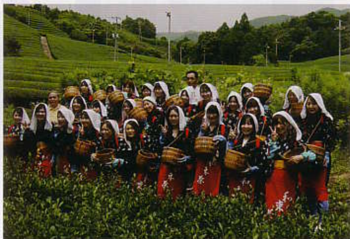
茶摘み体験。お昼には自分で摘んだ茶葉を天ぷらにして味わうお楽しみも。