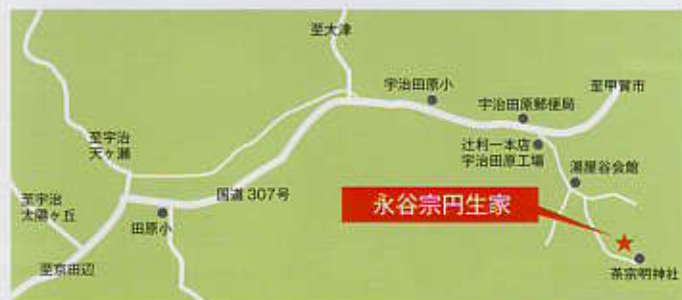
車の場合は湯屋谷会館に駐車して、そこから徒歩（15分）で向かうと、夏場も涼しい湯屋谷地域独特の雰囲気を楽しむことができます。