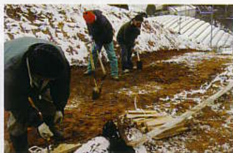
再生茶園オーナー体験。 荒廃した茶畑を整備して新たな苗木を植樹。