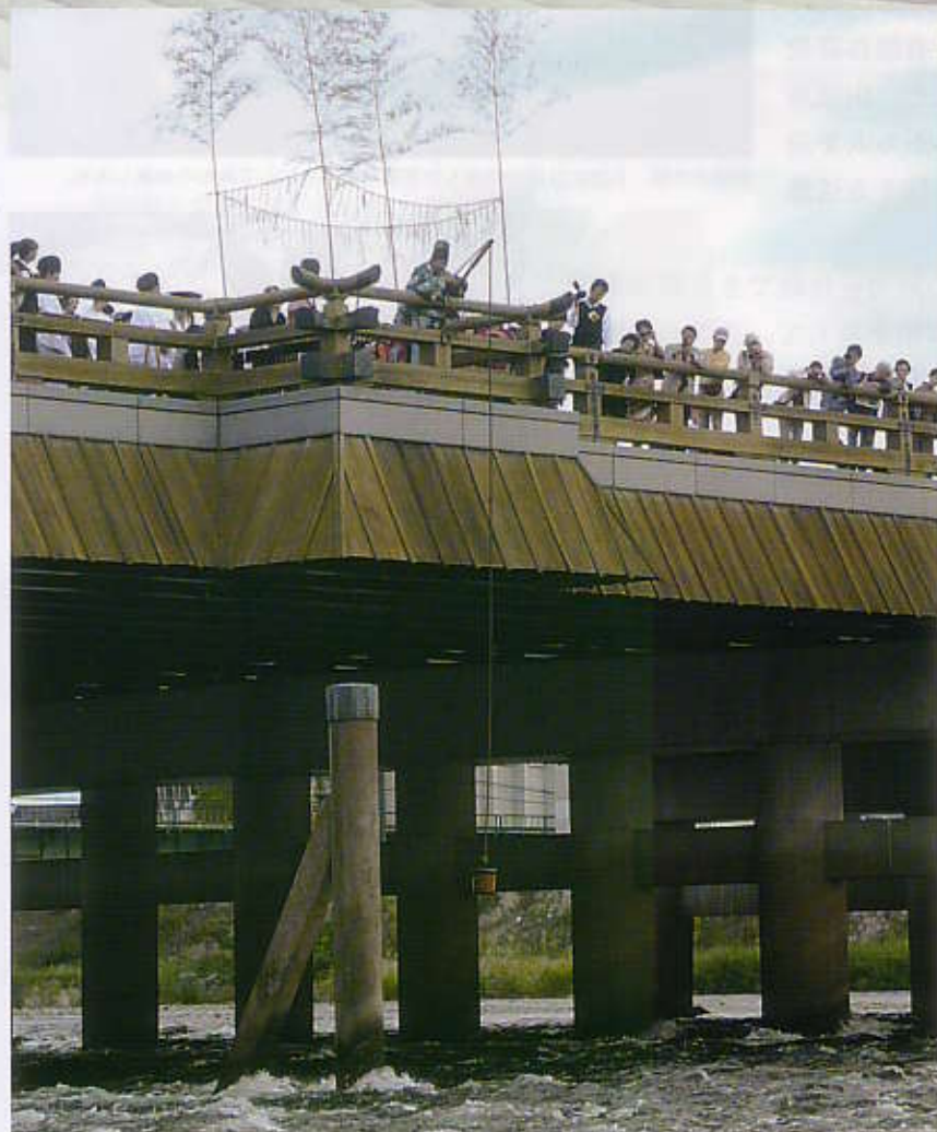
名水汲み上げの儀 豊臣秀吉が宇治川の水を汲んで茶会を開いた故事にちなみ、宇治橋「三の間」からシュロ縄につるした釣瓶で清水を汲み上げ、竹筒に移し、当時を想わせる衣装に扮した一行が、供茶の行われる興聖寺に運びます。