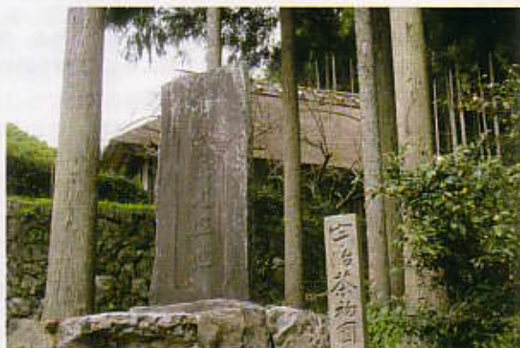
永谷宗円生家。土日など休日は見学可能。