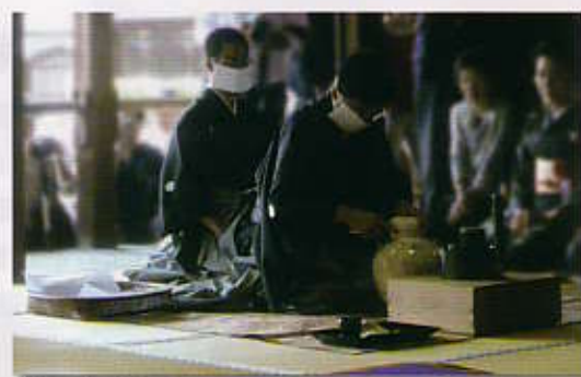
茶壺口切の儀 興聖寺にて、今年摘まれた新茶を入れ、茶まつりの日まで封をして仏前に供えられていた茶壺の口を切ります。その新茶を石臼で抹茶に仕上げ、三の間で汲み上げた名水でお茶を点て、茶祖に供茶します。