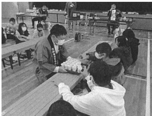
京都市茶業組合 「京都市立待鳳小学校 茶香服体験」

事業実績：茶道、煎茶道、日本茶インストラクターによる各呈茶席を設け、多様な喫茶文化の紹介をすることで、宇治茶振興に寄与し、宇治茶の消費拡大に繋げることを目的とした交流茶会を開催した。[11月28日(日)、場所：福寿園CHA遊学パーク、参加者120名]