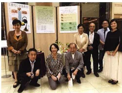
NPO法人 五節句文化アカデミア 「『重陽と宇治茶』展示会」