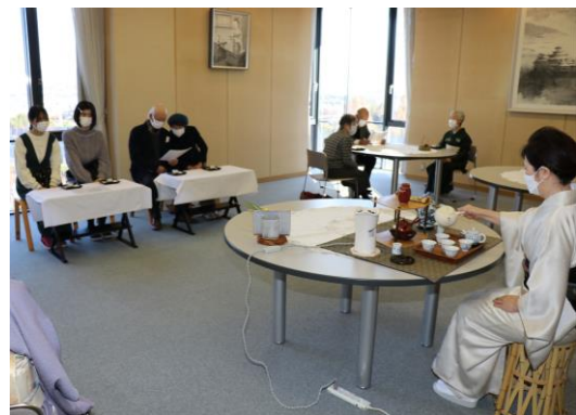
山城喫茶文化連盟 「喫茶交流茶会」