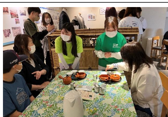
京都文教大学 (縁庵マルシェ)