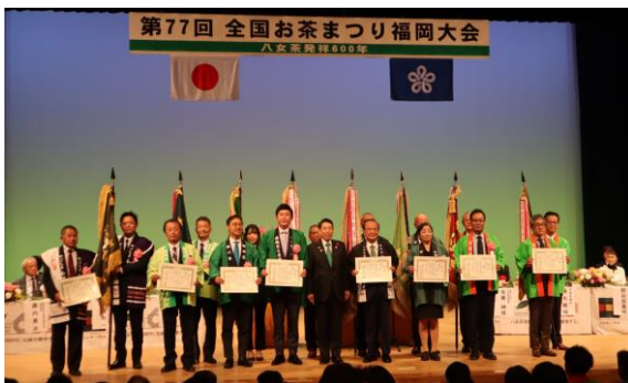
第77回全国お茶まつり福岡大会