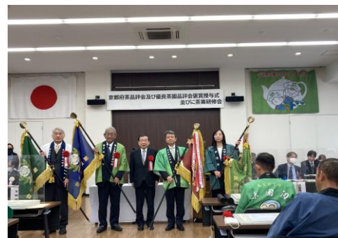
第75回関西茶業振興大会